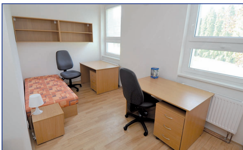
Studenti mají modernější pokoje s novým nábytkem.

Celkové náklady, které hradil Středočeský kraj, činily zhruba 11 milionů korun.