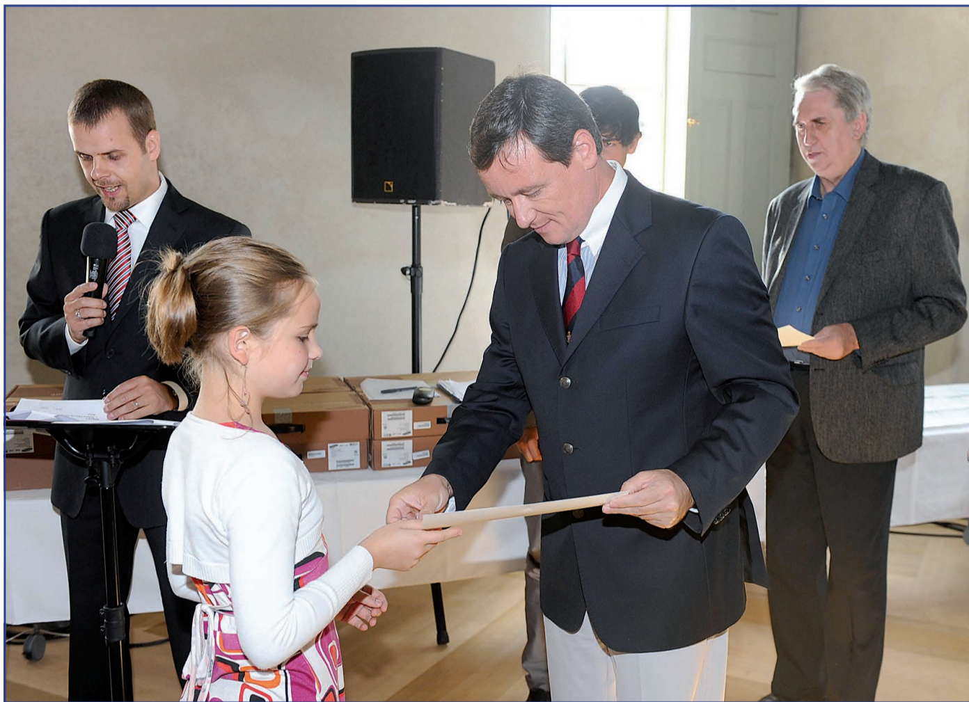
Vítězové soutěže si z rukou hejtmana převzali nejen diplom, ale také hodnotné ceny.

Nedávno proběhlo v GASK v Kutné Hoře slavnostní vyhlášení vítězů umělecké soutěže pro žáky a studenty Náš Kraj, kterého se osobně zúčastnil také středočeský hejtmán.