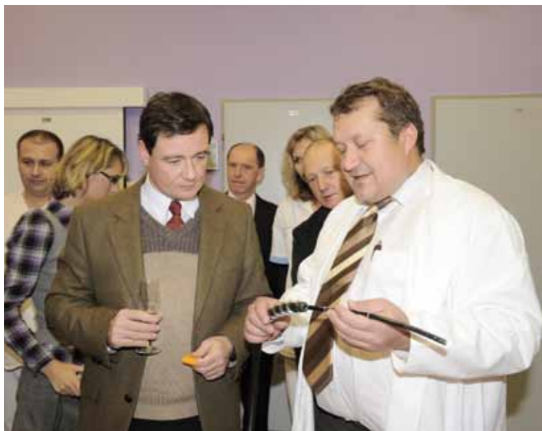
Ještě jedna momentka ze zmíněného slavnostního otevření Endoskopického centra

nebylo na světě. A podobných příběhů jsou stovky. Mí lékaři se mě dřív ptali, proč je učím všechno, co umím, protože tak ztrácím svoji výjimečnost. Vždycky jsem odpovídal, že se musejí ještě hodně snažit, ale že budu hrdý, až budou všechno umět líp než já. A ve skutečnosti jsou i oni obrovskou motivací, abych se i já snažil být stále lepší.