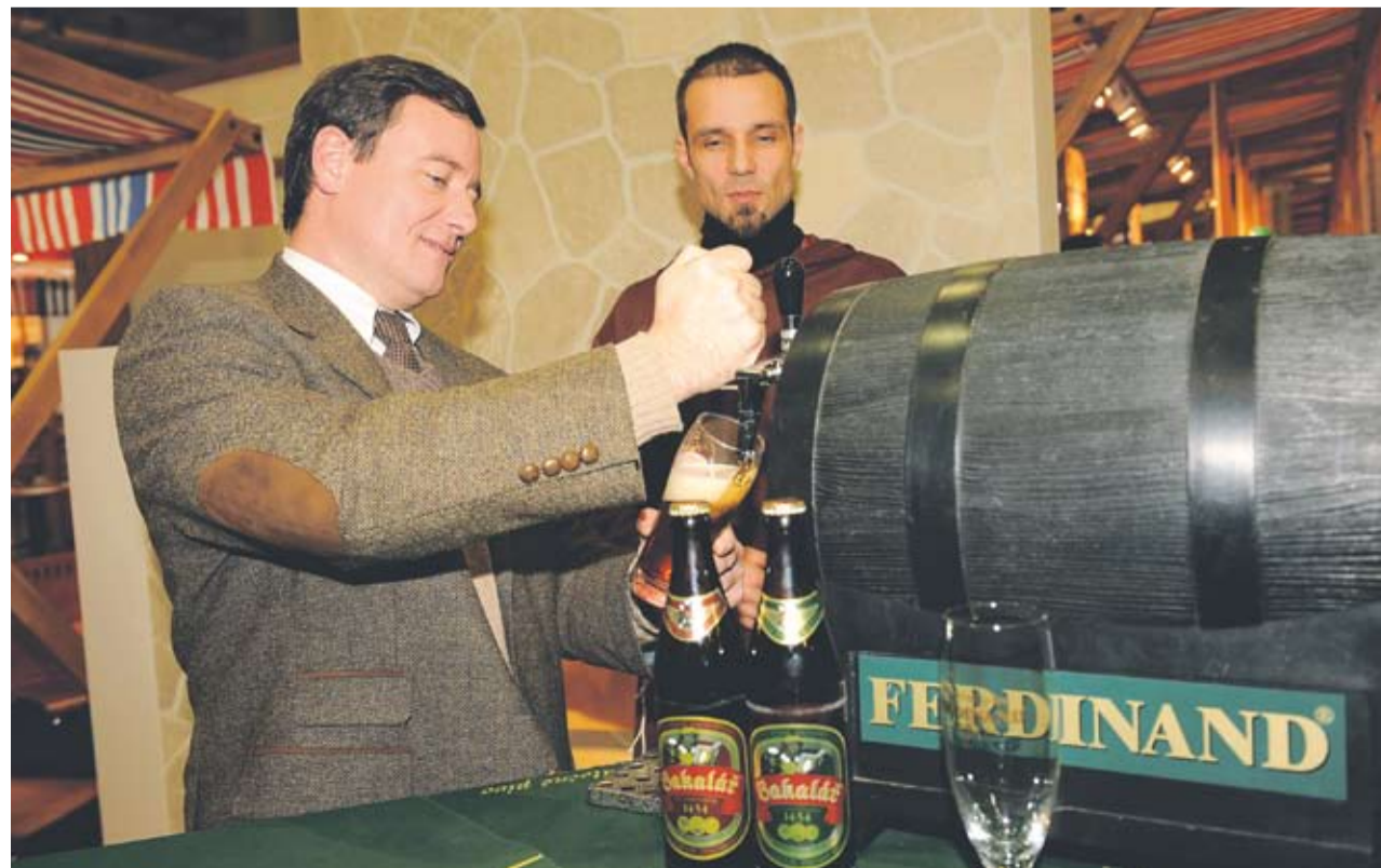
Muž za pípou byl nejen Středočechům poněkud povědomý.

Dalším veletrhem, na kterém se Středočeský kraj bude výrazně prezentovat, je Holiday World. Na pražském Výstavišti se koná od 5. do 7. února.