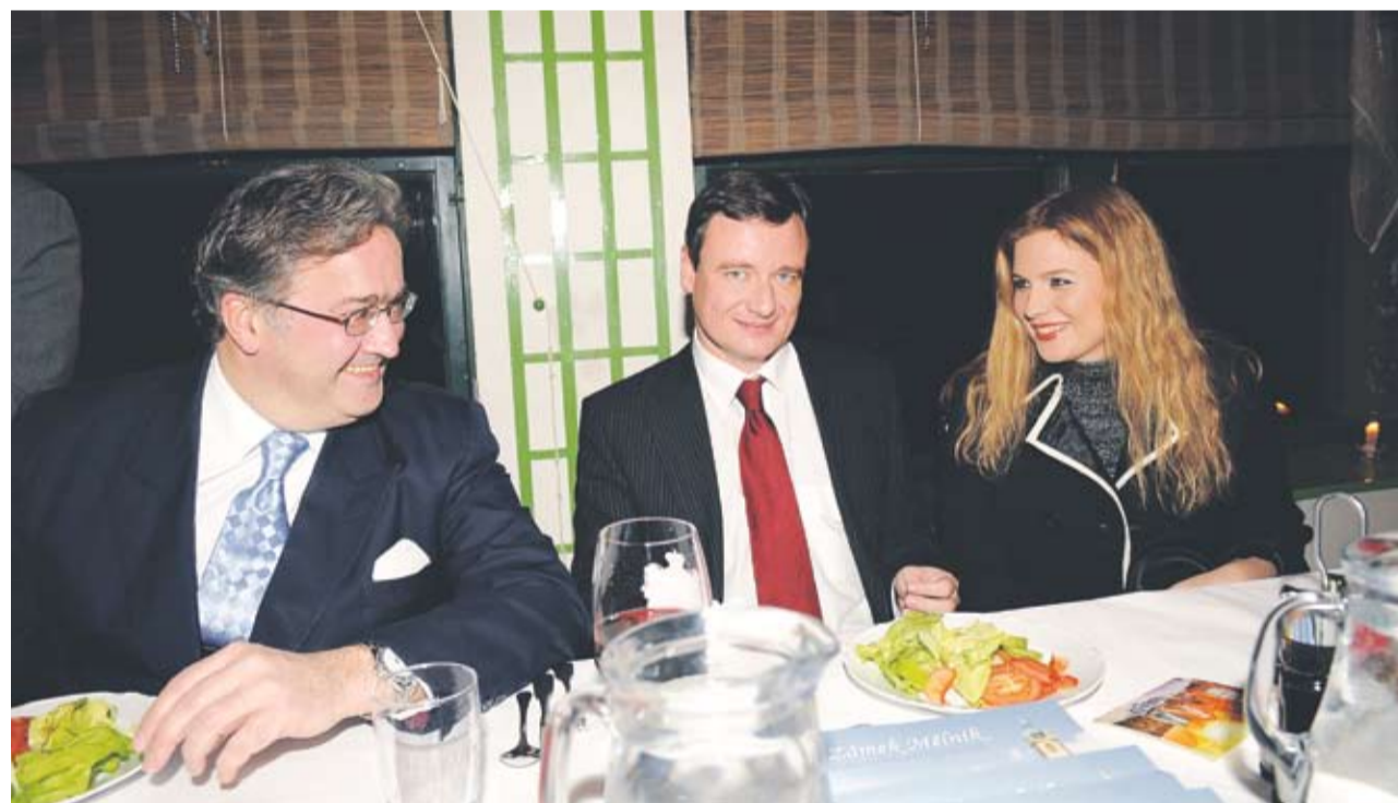
ZÁMECKÁ VEČEŘE. Středočeský hejtmán David Rath uspořádal 9. ledna novoroční večeři na zámku v Mělníku. Mezi pozvanými hosty byly významné osobnosti Středočeského kraje z oblasti kultury, podnikatelé i zástupci managementu krajských institucí.

Družstvo 92 nemělo na turnaji vypsanou kategorii, startovalo tedy se staršími 91. Bohužel se v této skupině sešli pozdější finalisté, a tak v ní Sadská skončila po těsné prohře s týmem Helmy na 3. místě. To ji odsoudilo do bojů o postup do tzv. B-finále, kam se po dalších výhrách probjovala a v něm i zvítězila trojkovým hodem několik sekund před koncem utkání! Do Sadské se za obrovských ovací rodičů, spojených i s ohňostrojem, vrátily hráčky se třemi poháry a maximálně spokojené.