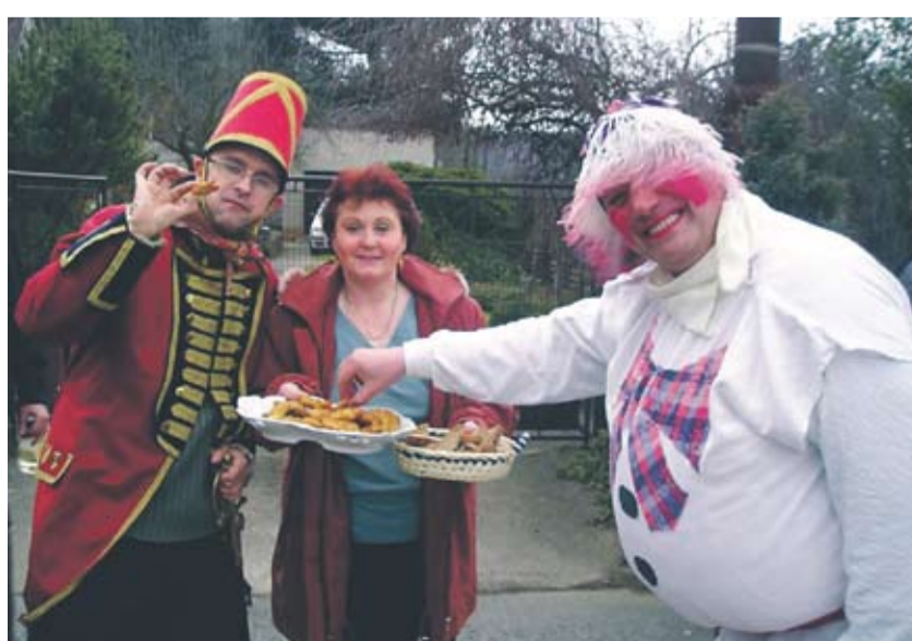
Tradiční masopustní idylka...

Jeho součástí je kromě zabijačky, masopustní frašky na návisi a symbolického pochovávaní Masopusta také vystoupení folklorních souborů a několik soutěží – o neoriginálnější masopustní maškaru člověka i zvířete, o nejchutnější koblíhu apod. Letošní novinkou je soutěž o nejnápaditější masopustní vozidlo.