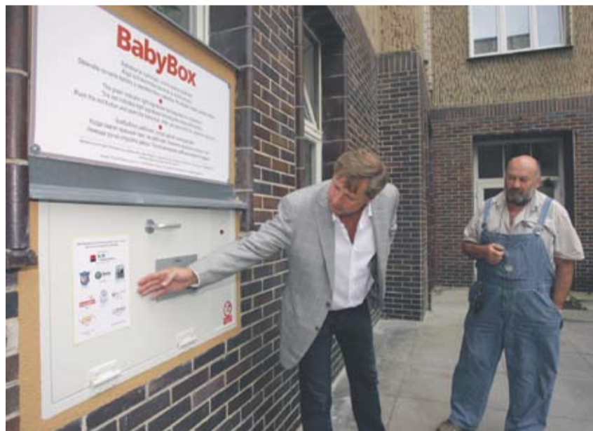
Podle bývalého hejtmana se postupovalo dobře.

kraj vytváří v oblasti zdravotnictví nerovné podmínky. Reagují na to negativně už dnes města, která zřizují své nemocnice, i ostatní poskytovatelé zdravotní péče. Každé nerovné podmínky přitom zakládají další problémy do budoucna. Mohlo by například dojít k destabilizaci celého systému. Přál bych si, aby došlo na celostátní úrovni k úpravě poplatků. Byli od nich například osvobozeni novorozenci a děti. Konečně v tomto duchu se vyslovila i lékařská komora. Kraj by se potom měl vrátit k normálnímu režimu a zaměřit se znovu na zkvalitňování péče o pacienty a zlepšování podmínek pro zdravotnický personál. To byly naše hlavní priority. Nemocnice nakupovaly nové diagnostické přístroje, pracovaly na zkvalitnění péče a podařilo se také zlepšit odměňování lékařů i sester. Úhrada poplatků z krajské pokladny je jen čistý populismus, který nic jiného kromě dočasných stranických preferencí nepřináší.