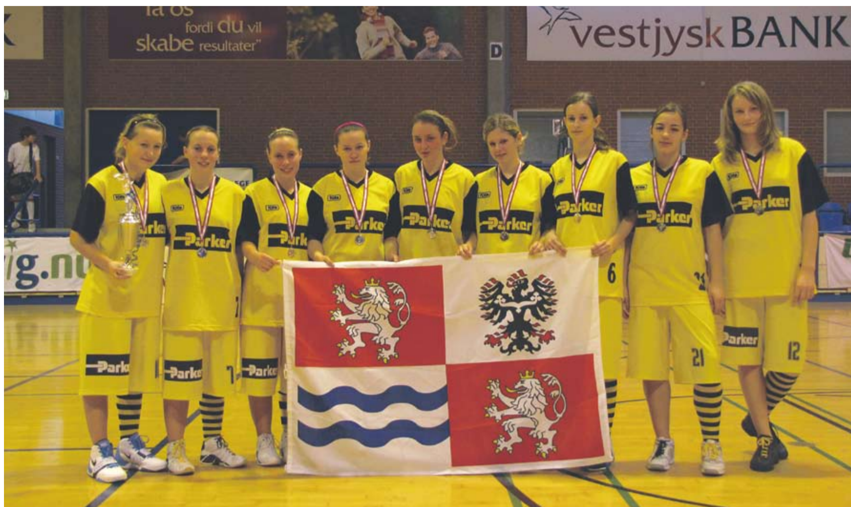
Školní basketbalový klub Sadská se měl na turnaji k světu.