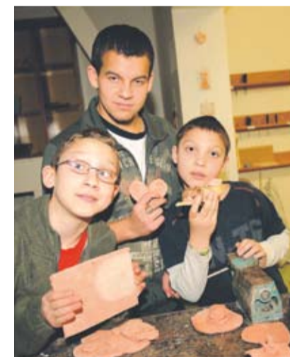
Děti z dětských domovů mají většinou Vánoce velmi smutně, přestože materiálně nestrádají.