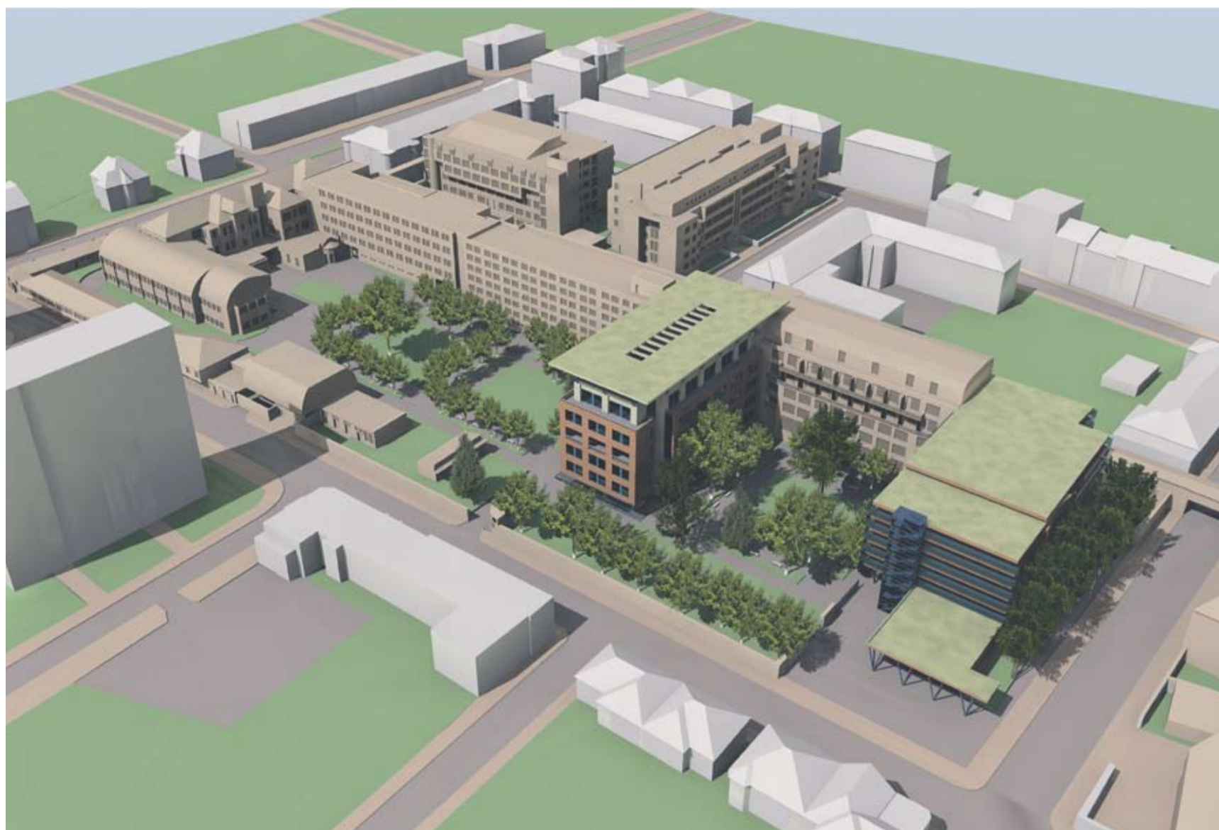
Nová podoba mladoboleslavské nemocnice.

Přestože od 1. ledna hlásá nepřehlédnutelná cedule u hlavního vchodu do budovy, že za pacienty uhradí regulační poplatky Středočeský kraj, automat ve vstupní hale stojí dál a několik dalších je rozmístěno na ambulancích. „Zbytečné určitě nejsou. Někteří pa-