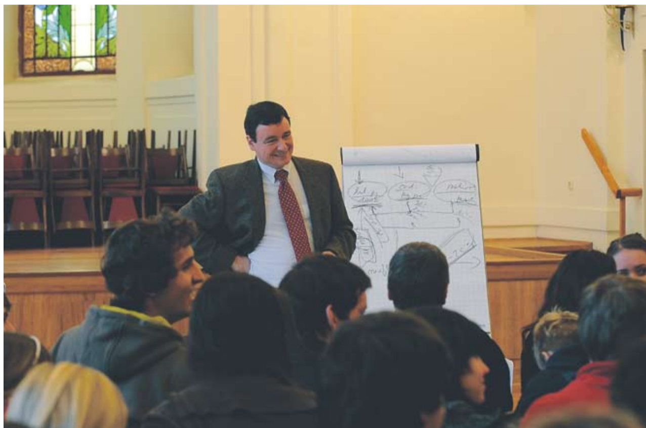
Středočeští studenti by se již brzy mohli vzdělávat na nové univerzitě.

hodnuto. Vedení kraje oslovilo střední školy i veřejnost, aby vybraly z několika navržených možností. „Školám se s přehledem nejvíce líbil název Královská univerzita střední Čechy. Druhá skončila Středočeská univerzita Jiřího z Poděbrad,“ uvedla mluvčí hejtmanství Berill Mascheková s tím, že v anketě