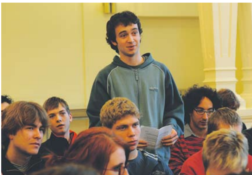
Studenti se na besedu velmi dobře připravili.

A jak to tedy dopadlo? „Byl jsem spokojen, myslím, že odpovídal celkem přímě. I když tak vysoký politik, jako je on, musí mluvit obrátě a do jisté míry se musí umět zavděčit každému.“