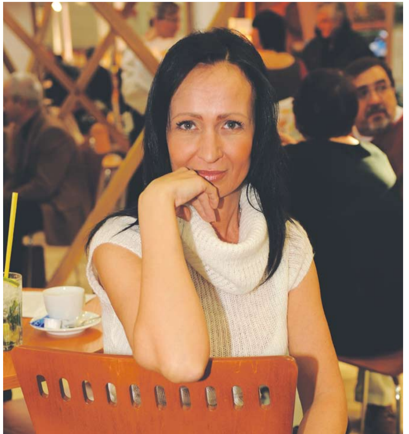
Nová ředitelka STIS má velké zkušenosti.

Já jsem se do svého nejoblíbenějšího místa ve středních Čechách přestěhovala z Prahy – je to Jílovsko, okolí Žampachu, štoly svatého Josefa... To je snad nejkrásnější místo, které jsem kdy viděla. Přijedte se podívat!