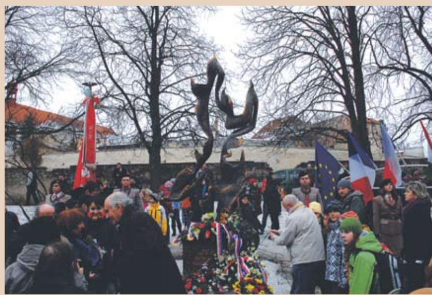
Odkaz Jana Palacha je stále živý...

Dalšími projekty, které byly v lednu z osmimilionového Fondu hejtnana podpořeny, jsou nákup automobilu Suzuki pro Občanské sdružení Kladno a masážní kurs v rehabilitačním středisku Dědina, který se specializuje na zrakově postižené.